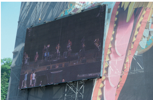
Konzertphoto vom Openair St. Gallen

In diesem Jahr werden weitere 1000 Cds, sowie mehrere tausend Downloads weltweit verkauft.