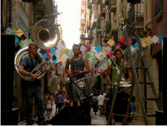
Konzertphoto von Barcelona